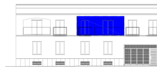
ALZADO DE CONJUNTO