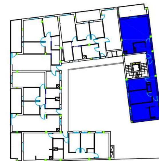
PLANO DE CONJUNTO