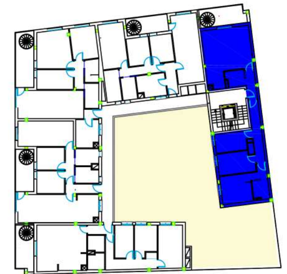
PLANO DE CONJUNTO